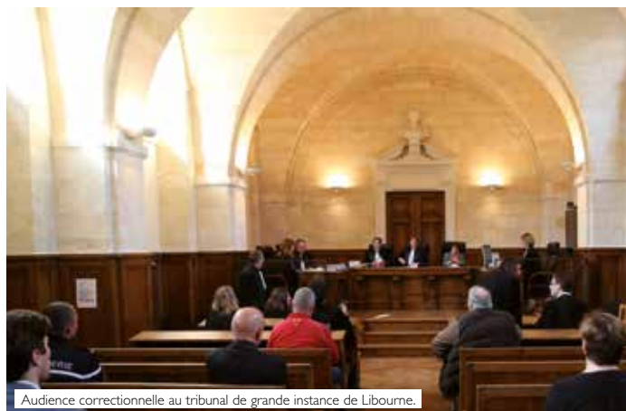
Audience correctionnelle au tribunal de grande instance de Libourne.

Pédagogie : Erick Martinville Logistique : Delphine Ropital enm-info-di@justice.fr Tél : +33(0)1.44.41.88.24