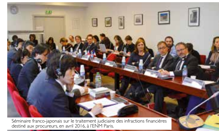
Séminaire franco-japonais sur le traitement judiciaire des infractions financières destiné aux procureurs, en avril 2016, à l'ENM Paris.